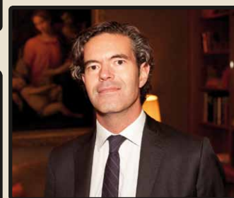
Henrik Mitelman, Dagens Industri.